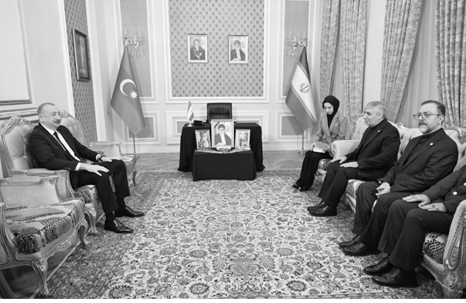
Azərbaycan Respublikasının Prezidenti İlham Əliyev martın 4-də İran